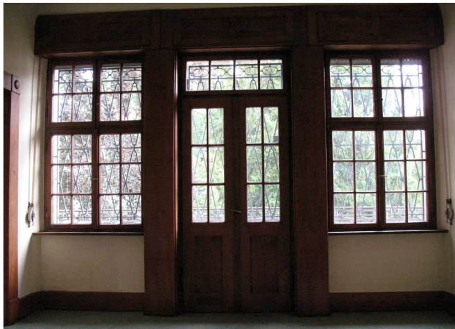
Fenster im Erker oben Fensterreihe im Dachgeschoss

Die Räume sind fotografisch erfasst. Die Bilddatei wird auf Anfrage zur Verfügung gestellt.